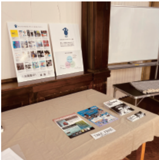
チラシ配布ブース