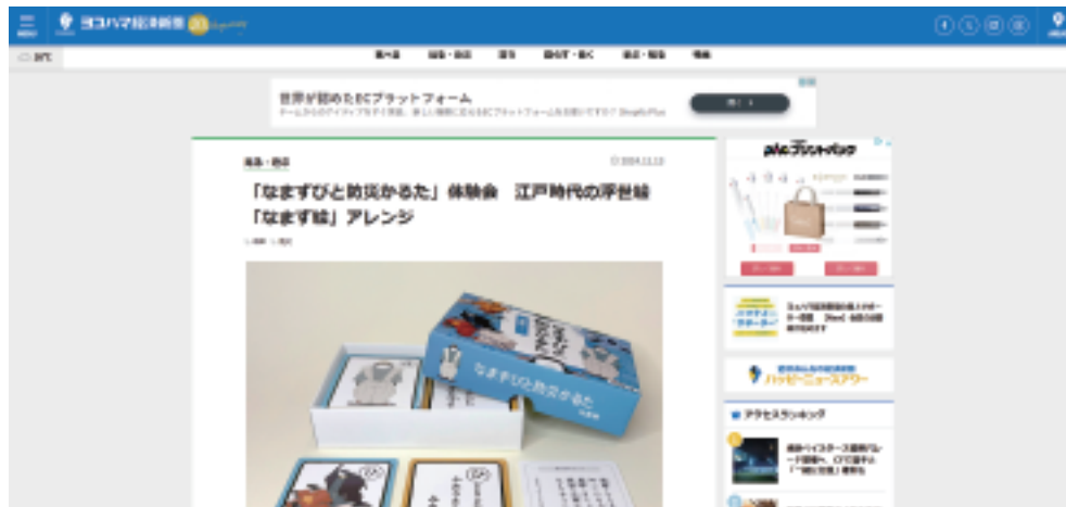
ヨコハマ経済新聞