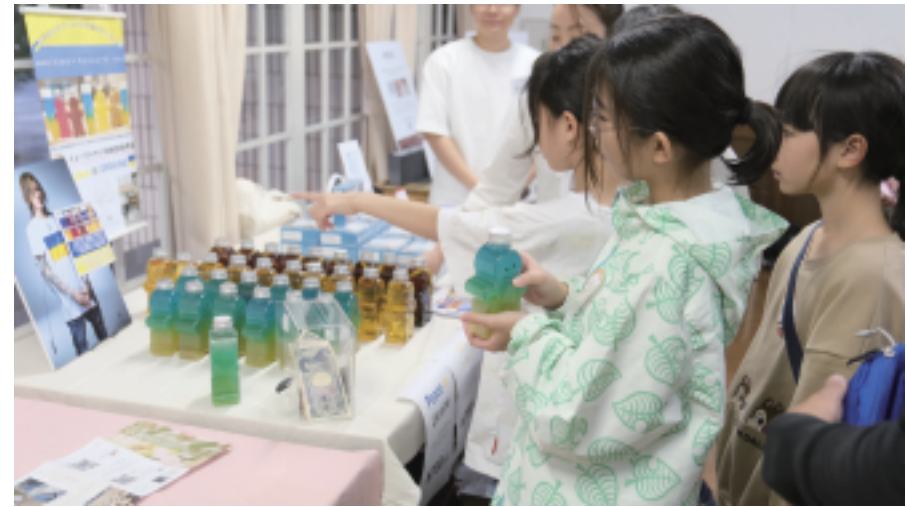
ココロゴトカフェさん