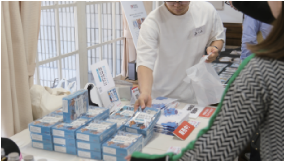
かるた 5箱 (目標数達成!)