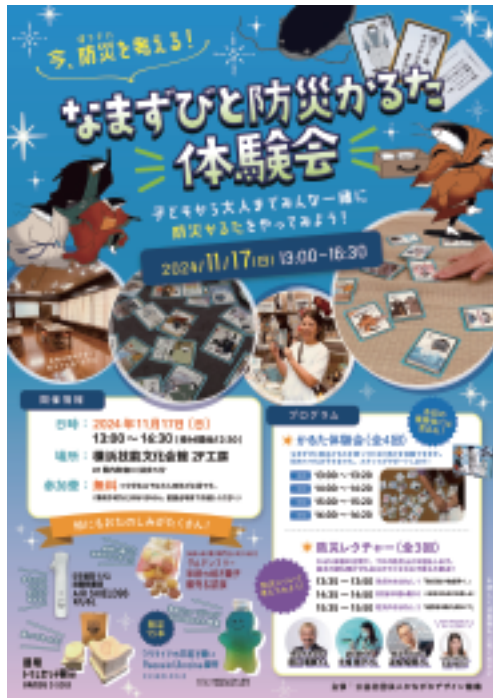
チラシ 500 部